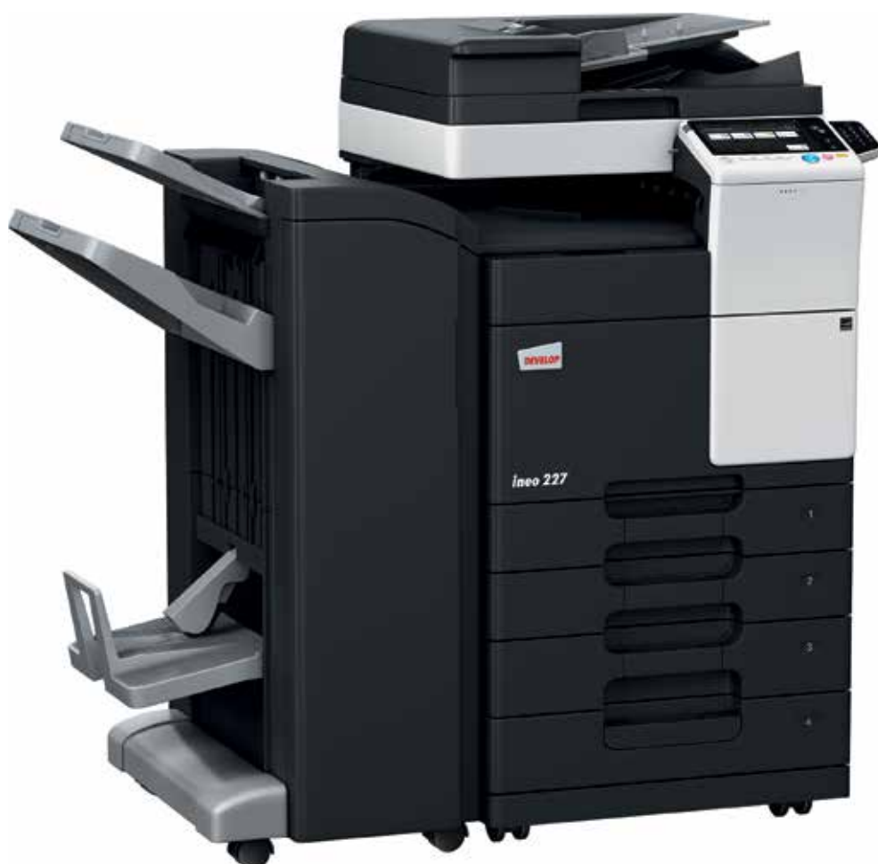
ineo 227 com alimentador de documentos (DF-628), finalizador de brochuras (FS-534SD), cassette de papel (PC-213) e teclado numérico (KP-101)

Os equipamentos monocromáticos representam uma variedade de funções que reduzem o consumo energético. Além de lhe poupar dinheiro, estas caraterísticas verdes também fazem bem ao ambiente – e à sua pegada de carbono.