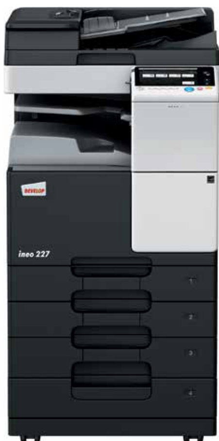
ineo 227 com alimentador de documentos (DF-628), separador de trabalho (JS-506) e cassette de papel (PC-213)