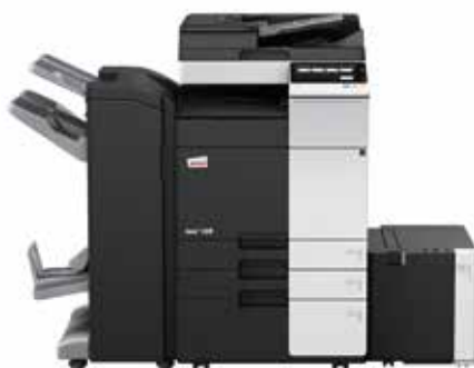
ineo+ 258 com alimentador de documentos dual scan (DF-704), finalizador de brochuras (FS-534SD), cassette de grande capacidade (LU-302) e cassette de papel (PC-410)