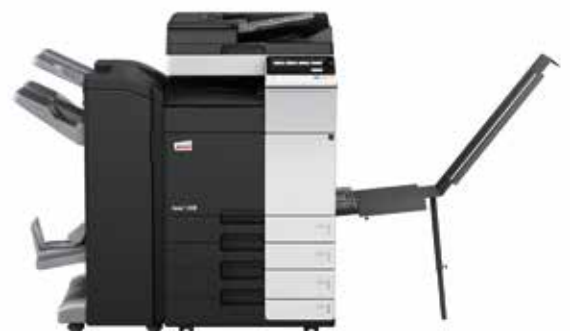
ineo+ 258 com alimentador de documentos dual scan (DF-704), finalizador de brochuras (FS-534SD), tabuleiro banner (BT-C1e) e cassette de papel (PC-210)