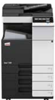
ineo+ 258 com alimentador de documentos dual scan (DF-704), tabuleiro de saída (OT-506) e cassette de papel (PC-210)

Invista numa ineo+ 258 e já não fica dependente de lojas externas para os trabalhos especializados como por exemplo convites impressos em papel grosso de alta qualidade. Isso irá poupar-lhe muito tempo e dinheiro. A ineo+ 258 pode lidar com envelopes, papel reciclado, papel pré-impresso, acetatos, muitos outros suportes e até mesmo cartão com uma espessura de até 300 g/m 2 . Estes sistemas podem imprimir numa ampla gama de formatos de papel desde A6 a A3+ (SRA3) ou formatos definidos pelo utilizador e banners até 1.2 metros de comprimento. E mais, as inúmeras opções de finalização permitem a criação de brochuras de até 80 páginas, cartas dobradas de várias maneiras, manuais agrafados ou fatu-ras furadas. Quase qualquer tipo de trabalho pode ser produzido internamente numa ineo+ 258.