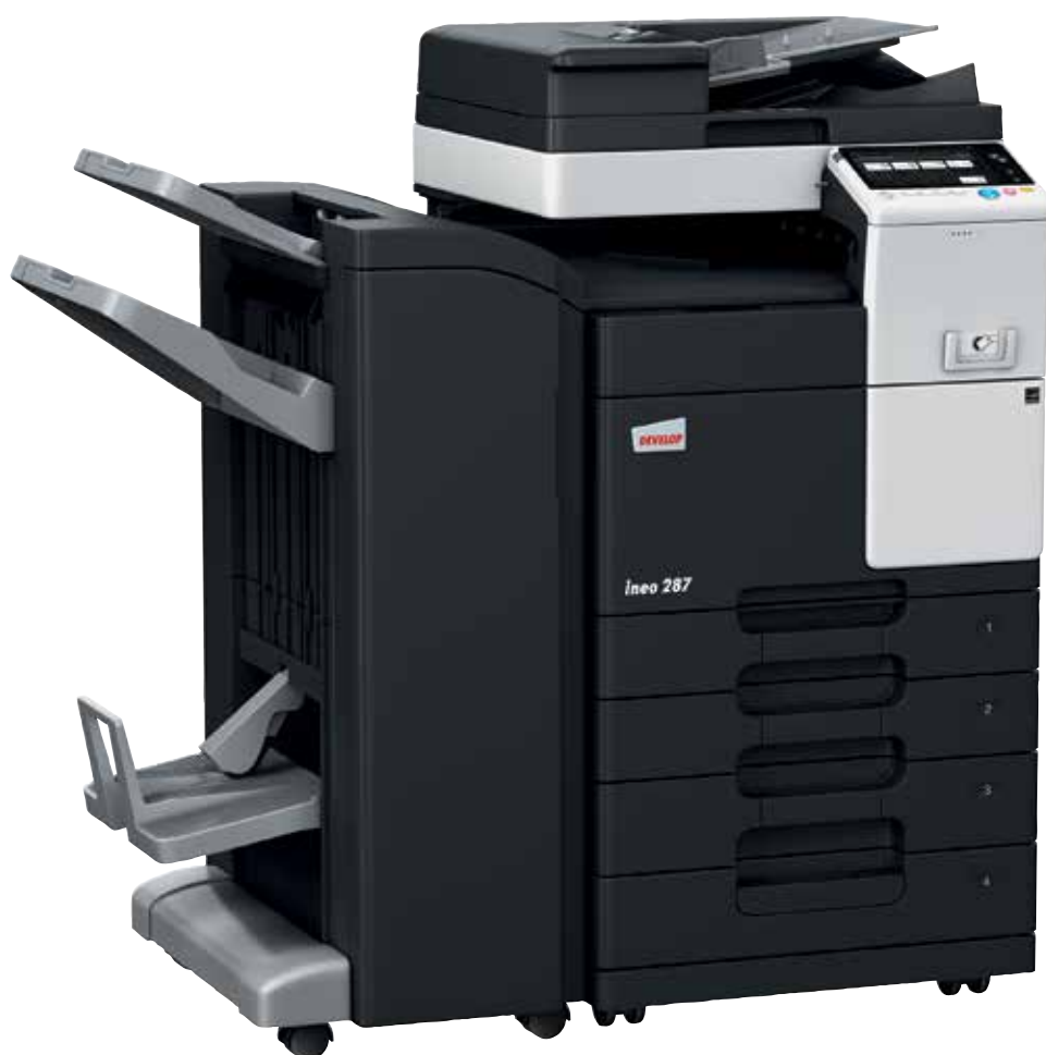
ineo 287 com alimentador de documentos (DF-628), finalizador de brochuras (FS-534SD), cassette de papel (PC-213) e kit montagem para dispositivo de autenticação por cartão (MK-735)

Os equipamentos monocromáticos representam uma variedade de funções que reduzem o consumo energético. Além de lhe poupar dinheiro, estas caraterísticas verdes também fazem bem ao ambiente – e à sua pegada de carbono.