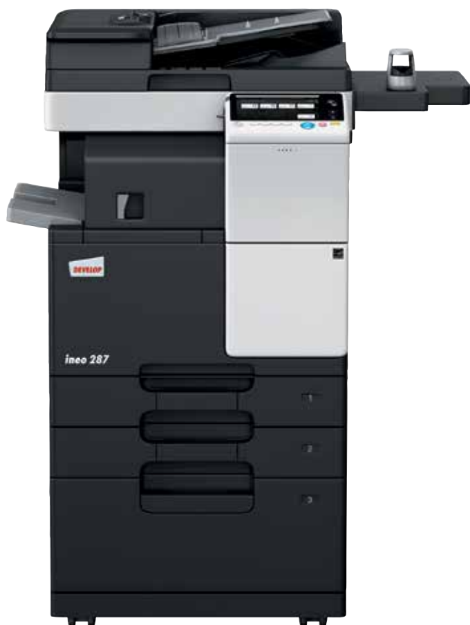
ineo 287 com alimentador de documentos (DF-628), finalizador interno (FS-533), cassette de papel (PC-413) e kit de autenticação biométrica (AU-102)

Centros de emprego, escolas e universidades, empresas de engenharia, escritórios de arquitetos, companhias de seguros, bancos, bibliotecas: muitas pequenas e médias empresas ou organizações realmente não precisam de capacidades de impressão a cores. O que os seus utilizadores realmente necessitam é um multifuncional monocromático que é fácil de usar e oferece uma usabilidade móvel simples para um número cada vez maior de colaboradores móveis.