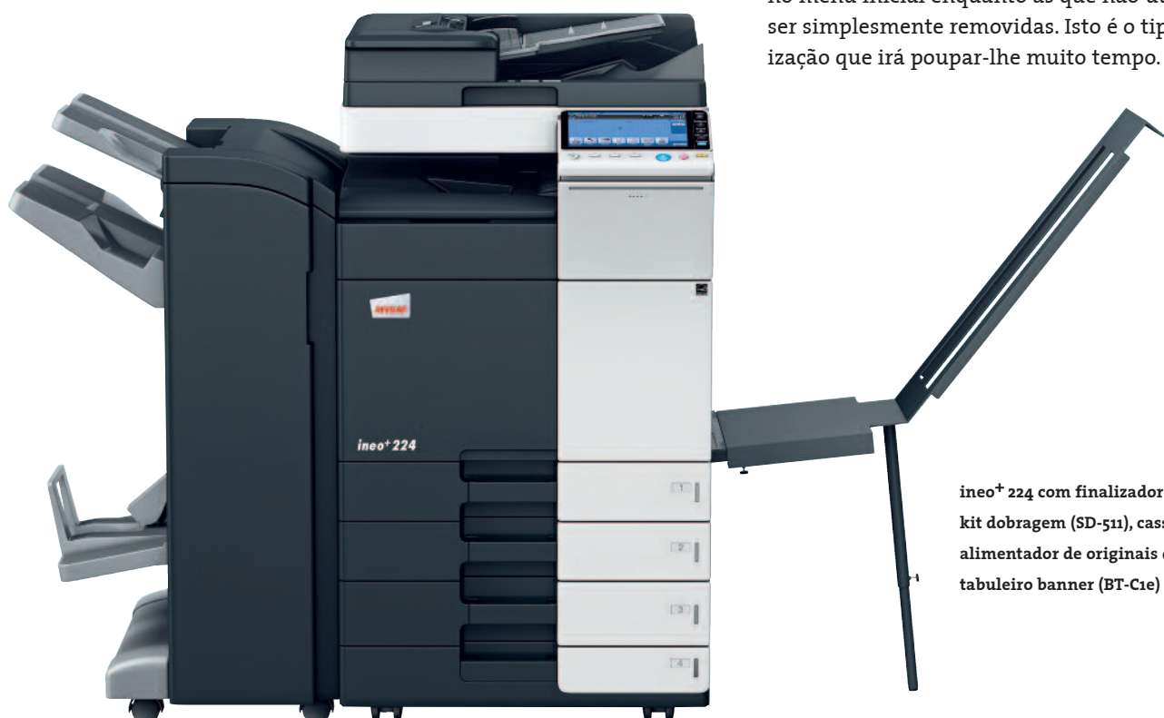
ineo+ 224 com finalizador agraphador (FS-534), kit dobragem (SD-511), cassetes de papel (PC-210), alimentador de originais dual scan (DF-701), tabuleiro banner (BT-C1e)

Muitos sistemas multifuncionais para o escritório são tudo menos fáceis de usar. Pelo contrário, a ineo+ 224 é pura simplicidade. Um conceito de utilização intuitivo e fácil de entender garante que é tão fácil de usar como o seu smartphone ou tablet. O painel tátil de 9 polegadas vem com funções bem conhecidas como flick&drag, e graças à sua estrutura de navegação por menus, consegue visualizar todas as funções de uma só vez e selecionar a configuração desejada em poucos passos. Funções frequentemente usadas podem ficar no menu inicial enquanto as que não utiliza podem ser simplesmente removidas. Isto é o tipo de personalização que irá poupar-lhe muito tempo.