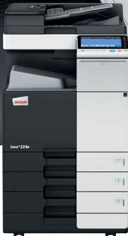
ineo+ 224e com cassete de papel (PC-110) e alimentador de documentos dual scan (DF-701)