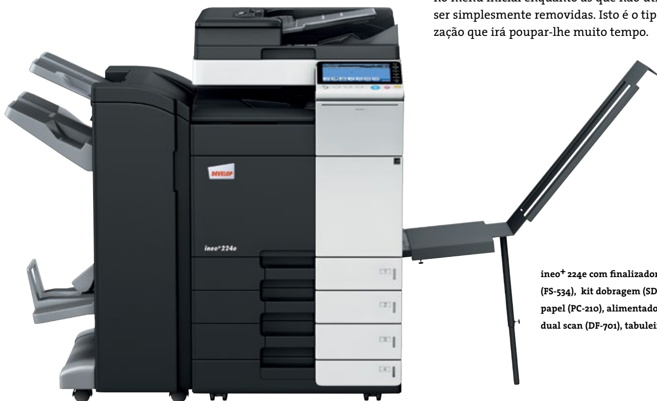
ineo+ 224e com finalizador agrafador (FS-534), kit dobragem (SD-511), cassetes de papel (PC-210), alimentador de documentos dual scan (DF-701), tabuleiro banner (BT-C1e)

Muitos sistemas multifuncionais para o escritório são tudo menos fáceis de usar. Pelo contrário, a ineo+ 224e é pura simplicidade. Um conceito de utilização intuitivo e fácil de entender garante que é tão fácil de usar como o seu smartphone ou tablet. O painel tátil de 9 polegadas vem com funções bem conhecidas como flick&drag, e graças à sua estrutura de navegação por menus, consegue visualizar todas as funções de uma só vez e selecionar a configuração desejada em poucos passos. Funções frequentemente usadas podem ficar no menu inicial enquanto as que não utiliza podem ser simplesmente removidas. Isto é o tipo de personalização que irá poupar-lhe muito tempo.