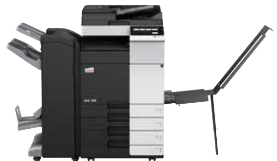
ineo+ 368 com alimentador de documentos dual scan (DF-704), finalizador de brochuras (FS-534SD), tabuleiro banner (BT-C1e) e cassette de papel (PC-210)