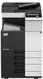
ineo+ 368 com alimentador de documentos dual scan (DF-704), tabuleiro de saída (OT-506) e cassette de papel (PC-210)

Invista numa ineo+ 368 e já não fica dependente de lojas externas para os trabalhos especializados como por exemplo convites impressos em papel grosso de alta qualidade. Isso irá poupar-lhe muito tempo e dinheiro. A ineo+ 368 pode lidar com envelopes, papel reciclado, papel pré-impresso, acetatos, muitos outros suportes e até mesmo cartão com uma espessura de até 300 g/m 2 . Estes sistemas podem imprimir numa ampla gama de formatos de papel desde A6 a A3+ (SRA3) ou formatos definidos pelo utilizador e banners até 1.2 metros de comprimento. E mais, as inúmeras opções de finalização permitem a criação de brochuras de até 80 páginas, cartas dobradas de várias maneiras, manuais agrafados ou fatu-ras furadas. Quase qualquer tipo de trabalho pode ser produzido internamente numa ineo+ 368.