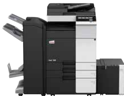
ineo+ 368 com alimentador de documentos dual scan (DF-704), finalizador de brochuras (FS-534SD), cassette de grande capacidade (LU-302) e cassette de papel (PC-410)