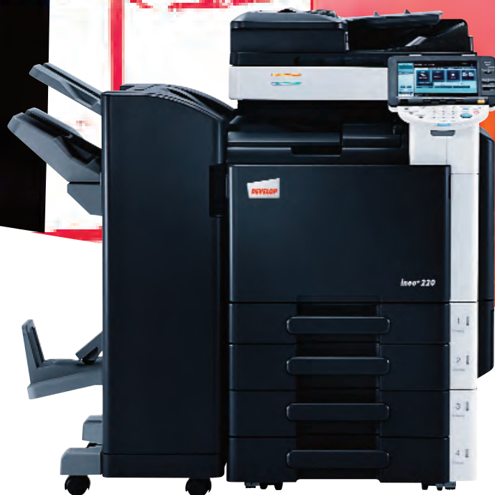
ineo+ 220 com alimentador de documentos (DF-617), finalizador de chão (FS-527), kit de agrafar em sela (SD-509) e tabuleiro universal de 2 x 500 folhas (PC-207)