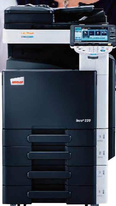
ineo+ 220 com alimentador de documentos (DF-617) e tabuleiro universal de 2 x 500 folhas (PC-207)