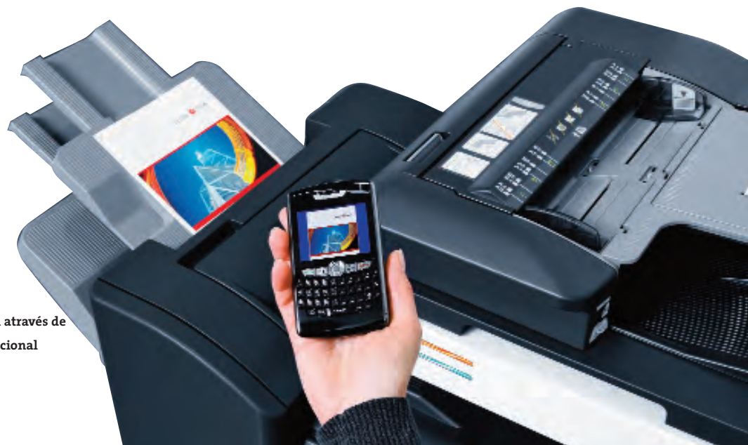
Impressão móvel possível através de uma ligação bluetooth opcional